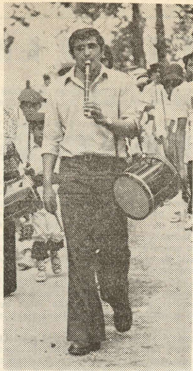
Txurruka, Mallabiako eratzaille purrukatu bat

● Frantses-legeak "pirula" onartu berri du, hau da: "Haurrik ez ukaiteko pirula libroan salduko dela farma-